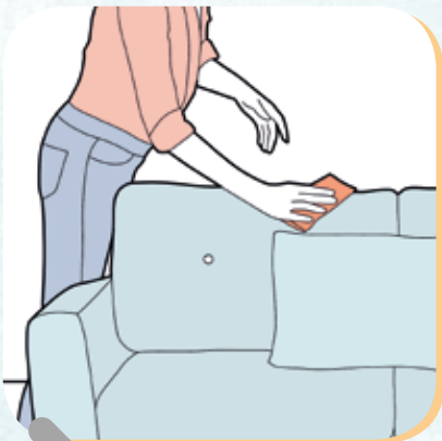
Polstermöbel gut putzen