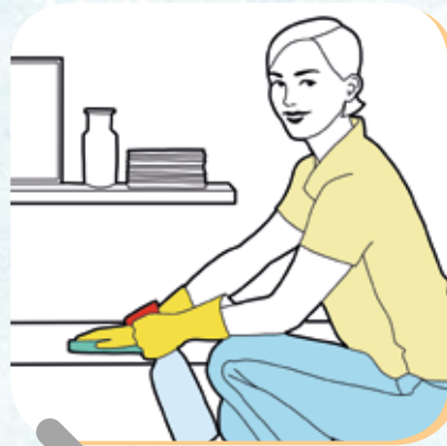
Möbel gründlich säubern