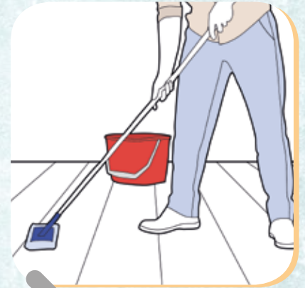
Boden feucht wischen