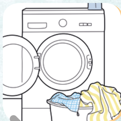
Vorhänge, Tischwäsche, etc. waschen