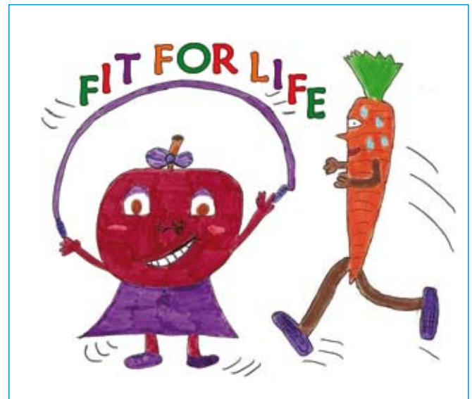
Fit for life in der Clemens Holzmeister Schule Grafenstein