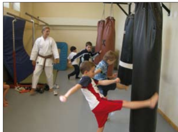
Mit Freude und Bewegung zu mentaler Stärke