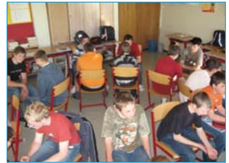
Persönlichkeitsbildung in der HS St. Georgen am Walde

Eine große Nachhaltigkeit konnte auch dadurch erreicht werden, dass mit den örtlichen Geschäften die Vereinbarung getroffen wurde, an PflichtschülerInnen keine Energy-Drinks zu verkaufen.