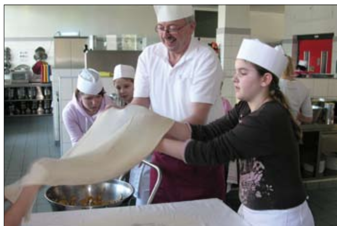
Gesunde Internatsküche im HIB Saalfelden

Das langfristige Projektziel ist die Umstellung der Ernährungsgewohnheiten, wobei die Einbindung der Projektmaßnahmen in die tägliche Arbeit der Schulküche Nachhaltigkeit zeigen soll.