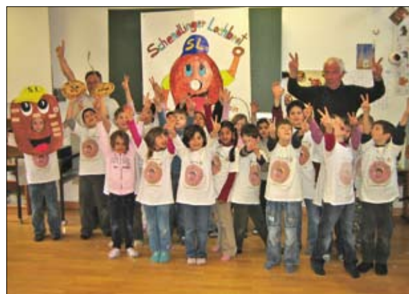
Die SchülerInnen sind stolz auf ihr selbst kreierte Schendlinger-Lochbrot

Ansprechpartner: Andreas Mikula, E-Mail: andreamikula@gmx.at Homepage: www.vobs.at/vs-schendlingen