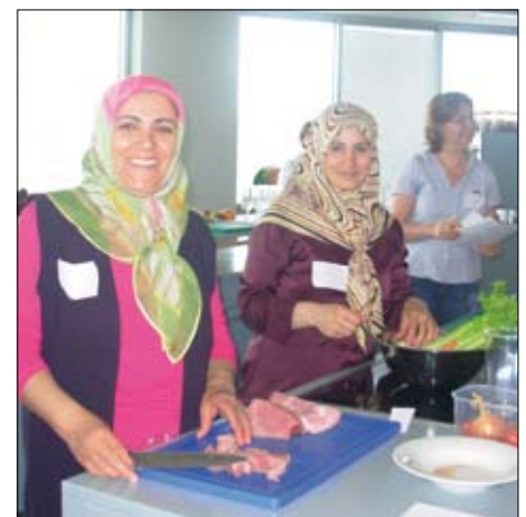
Mütter beim mehrsprachigen Kochkurs

Die Projektinitiative konnte im Schuljahr 2008/2009 bereits auf zehn Volksschulen in Oberösterreich ausgeweitet werden.