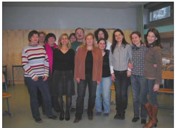
LehrerInnen des BISOP Baden