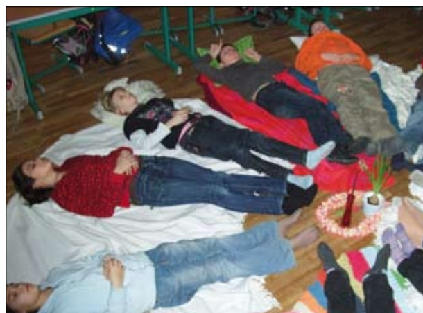
SchülerInnen entspannen sich in den Pausen

Im heurigen Schuljahr liegt ein Schwerpunkt bei der „Psychosozialen Gesundheit“. Das besondere Highlight bei den Maßnahmen ist jedoch der Ruheraum. Die Kinder werden mit Kerzenlicht, angenehmer Musik und bequemen Decken empfangen und Fantasiereisen, Atemübungen oder Geschichten ermöglichen Erholung und Ruhe in den Pausen. Der Andrang ist dementsprechend groß und Lernen bzw. Unterrichten geht dann wieder leichter!